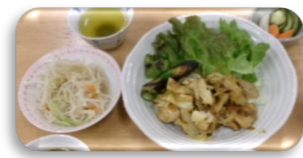
【4月 夕食会の一例 ：タンドリーチキン】