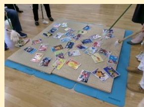
あいは一との特大カルタ♡