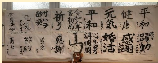
♡書初め作品… オープンスペースに展示中！

来館した皆さんとお汁粉を楽しみ、身も温かく、新年の爽やかさも分かち合えた楽しい時間となりました♪