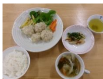
＜1月夕食会から…ふわふわ焼売＞