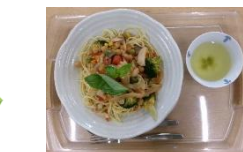
＜1月昼食会から…スープスパ＞